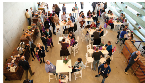
מתוך הכנס השנתי של העמותה, נובמבר 2016

אנו בעמותה שואפים לעולם בו חולי סרטן הריאה ומשפחתם זוכים לאיכות חיים מיטבית, מקבלים את כל האינפורמציה הדרושה להם ויודעים - שהם לא לבד. העמותה הוקמה כחלק מהבנת החוסרים בהתמודדות של חולים ובני משפחתם עם מחלת סרטן הריאה. צוות העמותה מגוון ומורכב מבני משפחה, חולים, אונקולוגים ומומחים ממקצועות הבריאות.